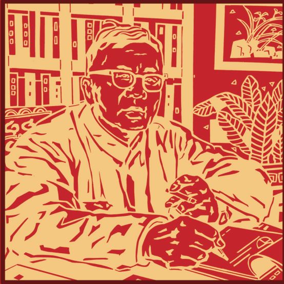
运城沈康 吕晶剪纸