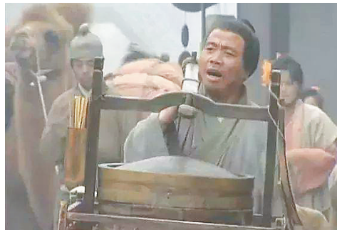
电视剧《水浒传》中武二郎卖炊饼剧照。

把馒头称为炊饼的叫法一直延续到了元朝末期。在《明史》中记载说，刚起兵的朱元璋被抓起来的时候，他的妻子马皇后就偷偷送炊饼给朱元璋吃，刚蒸好的炊饼把她身上的皮肉都烫伤了。明朝以后，炊饼的叫法才逐渐消失，人们直接称呼实心的炊饼为“馒头”。当然，这是题外话了。