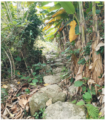
万陵古道遗址。