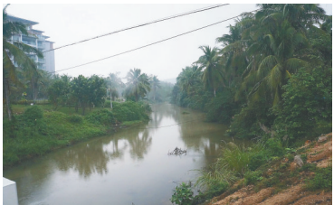
九曲水相傍县道沿九曲岭谷下行。