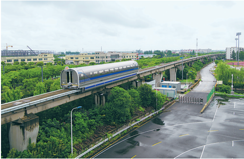
6月21日，时速600公里高速磁浮试验样车在磁浮试验线上试跑。

据了解，时速600公里高速磁浮交通系统研发进展顺利，在试验样车成功试跑的同时，5辆编组的工程样车研制也在稳步推进中。按照计划，时速600公里高速磁浮工程样车预计在2020年底下线，将形成高速磁浮全套技术和工程化能力。