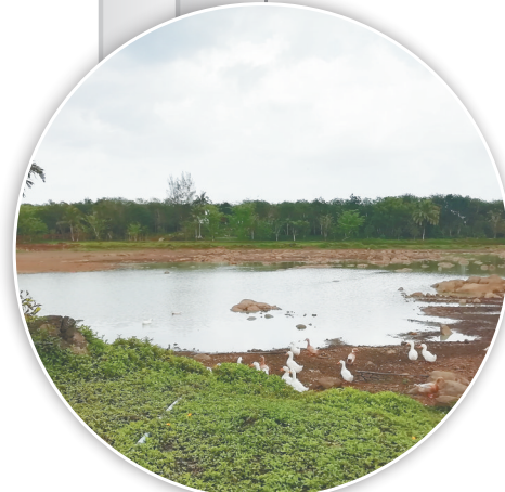
昌文湖周边绿草茵茵,白鸭成群。