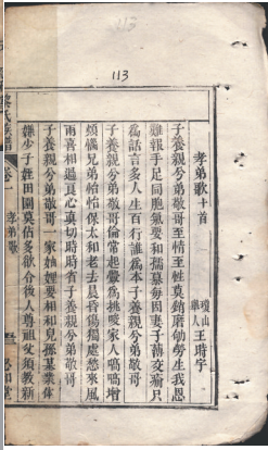
族谱收录琼山举人王时宇的《孝弟歌》。