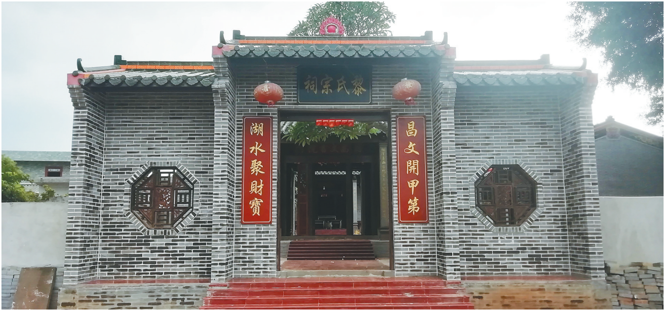
昌文湖边的黎氏宗祠。

走近黎氏宗祠,一副描金对联映入眼帘,左右两边上书“昌文开甲第,湖水聚财宝”十个大字。按谱牒记述:“昌文湖地,夫名昌文湖者,预卜克昌厥后,人文蔚起之兆。”村名