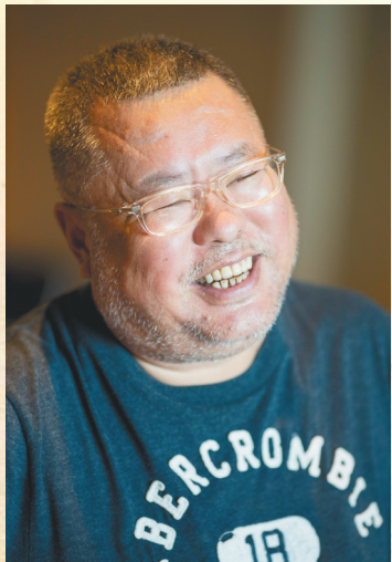
导演高群书

无论父母如何反对,高群书依然坚持自己的追求。辞职后没多久,高群书就接到了一单“大活”——拍摄20集纪实片《中国大案录》。这部讲述了三件大案的作品一经播出便引发热议,不仅在当时引发了全国纪实警匪片的热潮,也让高群书正式走上了影视创作的道路。