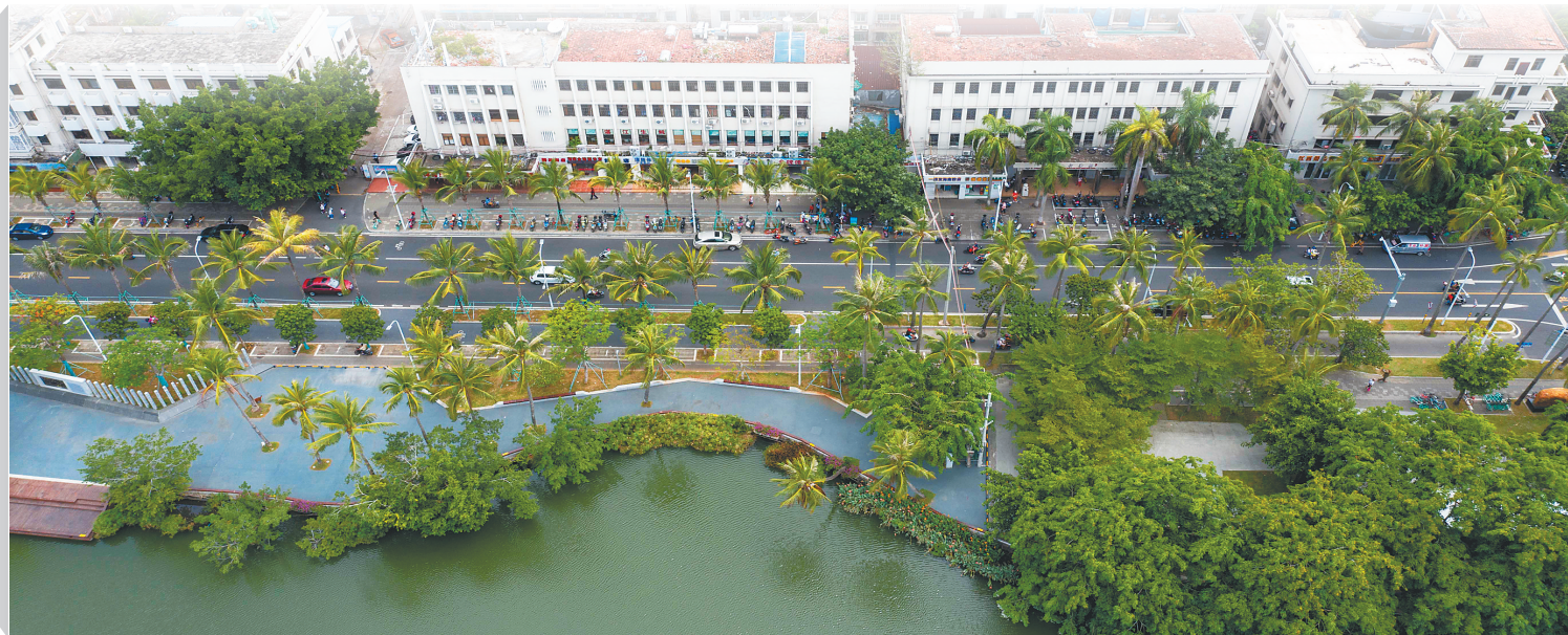
俯瞰东湖路。

沿着湖边行走,曾经的热闹喧嚣和驳岸的墙壁全都不见了,只有一方浅流湿地和一条长长的亲水栈道,走在栈道上,便可一览湖水映城的美景。■