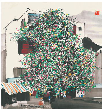
《海南人家》(珂罗版画) 吴冠中

作为一位学贯中西的独行者，他身上洋溢着中国优秀知识分子的人格魅力。艺术上不拘成法、开拓创新，生活上甘于淡泊，思想上与时俱进，性格上坚韧执着、坦然磊落，用2000多幅作品和150多万文字去完成对人生的思考与艺术的创造。《国际先锋论坛》称他是近半个世纪以来画坛的巨人。其间，法国文化部授予其法国文艺最高勋位（1991年），大英博物馆首次破例为他举办个展，并郑重收藏了他的巨幅彩墨作品《小鸟天堂》