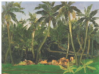
《椰林与牛》(综合版画) 吴冠中