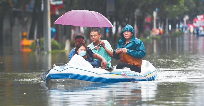
7月8日，在景德镇市瓷都大道，救援人员用橡皮艇转移受困群众。

新华社武汉7月8日电（记者李思远 乐文婉）8日10时，长江干流黄石港站水位达到24.51米，超过警戒水位0.01米。至此，长江干流监利以下江段全线超过警戒水位。 受近期强降雨影响，长江中下游干流水位持续上涨。5日5时莲花塘站突破警戒水位，此后干流站点监利站、九江站、南京站陆续突破警戒水位。7日，汉口、码头镇、安庆分别于当日7时、12时、13时达到警戒水位27.3米、21.5米、16.7米，当时长江中下游监利以下江段只剩黄石港站未达到警戒水位。目前，长江中下游干流监利以下江段各站日涨幅约0.1米至0.5米。截至8日8时，最大超警幅度在九江站，超警约1米。 长江水利委员会预计，未来几日，长江中下游干流附近将有强降雨维持，干流水位仍将继续上涨，最大超警戒幅度在1米至1.5米左右。