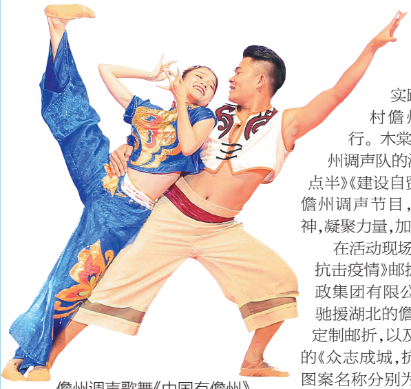
儋州调声歌舞《中国有儋州》