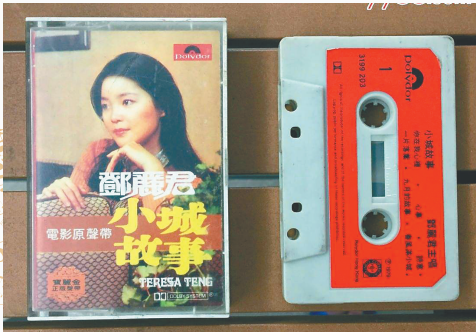
邓丽君的歌曲磁带。