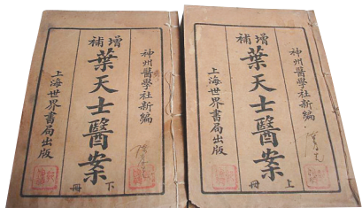
叶天士医案影响深远。（资料图）