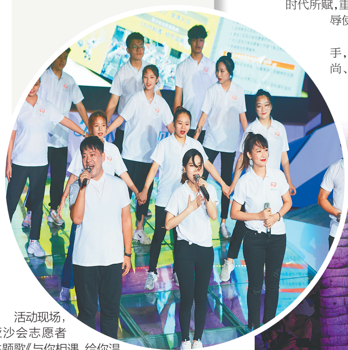
活动现场，亚沙会志愿者主题歌《与你相遇 给你温暖》发布。

在特殊中感受不同，在不同中孕育不凡。突如其来的新冠肺炎疫情使得亚沙会的筹办工作面临更大挑战。安全、科学、专业地做好筹办工作，不仅是整个国际社会的期待，也是党和人民赋予亚沙会沉甸甸的使命。在办赛的关键时刻，亚沙会一边紧抓疫情防控，迎难而上，在中央、省市主要领导和多部门的支持下，精心谋划，确保办赛节奏不乱、工作不落、效果不打折扣，以超常规的认识、举措、行动争取超常规的成效，汇聚成“高效办赛、专业谋城”的强大力量，谱写出“砥砺前行、矢志前行”的辉煌篇章。