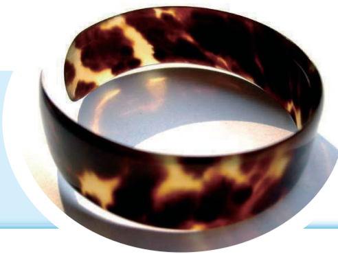
过去用玳瑁壳（俗称“十三鳞”）制作的手镯。

无独有偶。汉武帝元封元年（公元前110年）在海南岛置珠崖儋耳二郡。珠崖郡辖五县，其中有一个“玳瑁县”。据学者考证，玳瑁县治所在今海口市琼山区府城镇南30公里的龙塘镇，辖今琼山区沿海地带，玳瑁县乃因该地当年盛产玳瑁而得名。☐