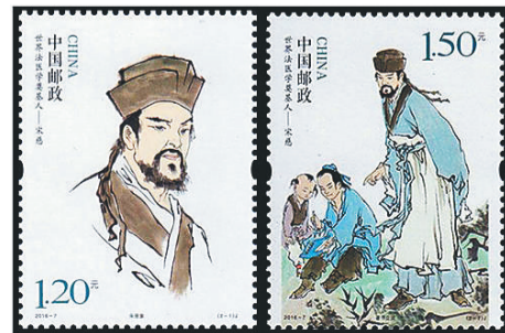
2016年，中国邮政发行的“世界法医学奠基人——宋慈”的邮票一套两枚。