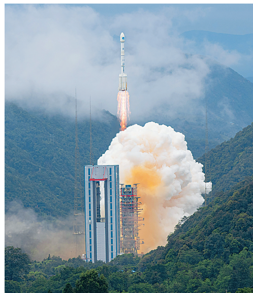
6月23日，我国北斗三号全球卫星导航系统最后一颗组网卫星在西昌卫星发射中心点火升空。