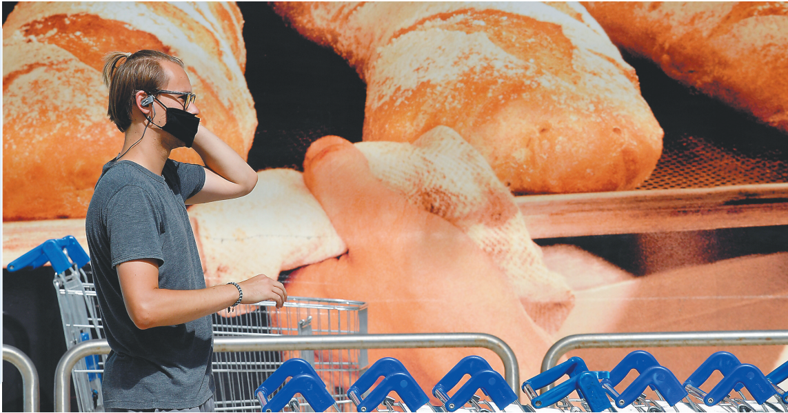
男子准备进入超市。