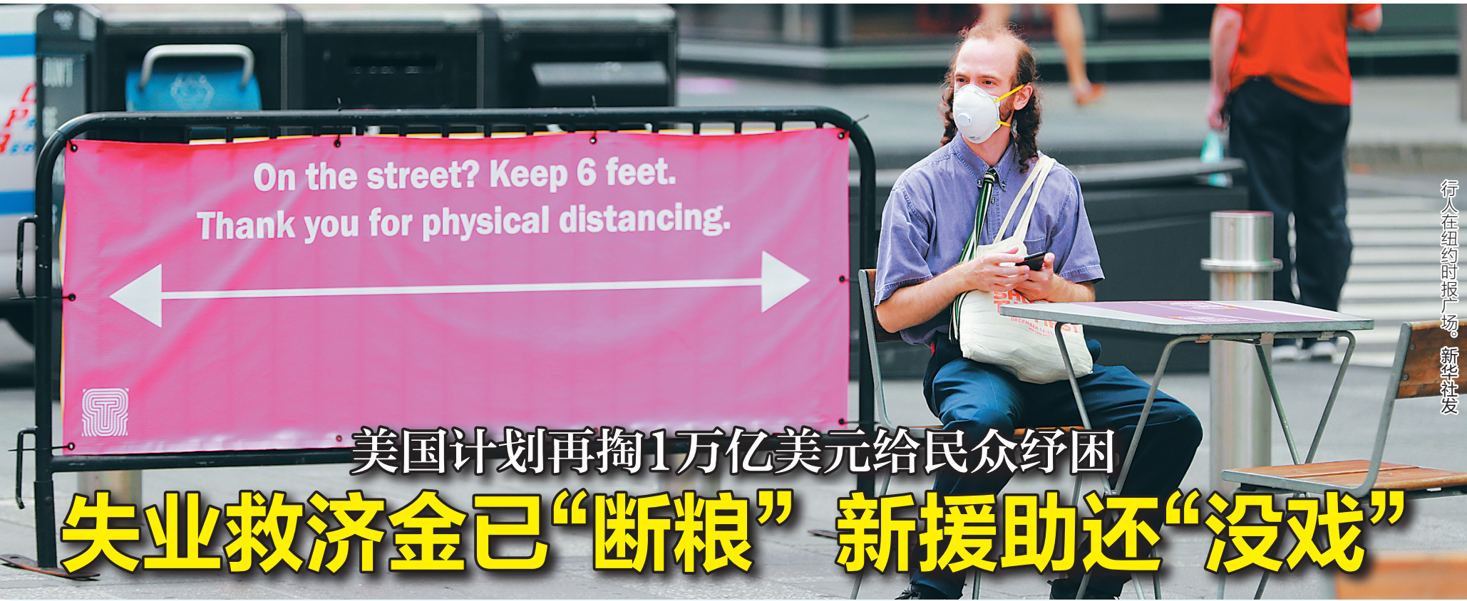
行人在纽约时报广场。