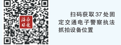
扫码获取37处固定交通电子警察执法抓拍设备位置

海口交警提醒广大机动车驾驶人，驾车出行要严格遵守道路交通安全法律法规，自觉按照道路交通信号灯、标志、标线指示有序通行，做到文明驾驶、安全出行。