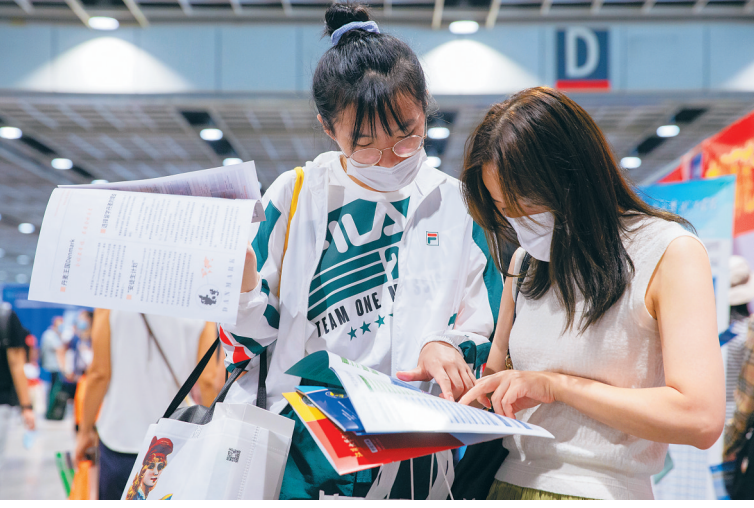
7月25日，江苏省2020年高考考生职业生涯规划与志愿填报咨询会在南京国际展览中心举行，来自国内百余所高校的招生工作人员向考生和家长现场讲解招生政策、专业选择、志愿填报等情况。

大学招生制度的改革，多元人才成长通道的搭建，也给予了新一代年轻人更广阔的成长空间、更充分的选择机会。