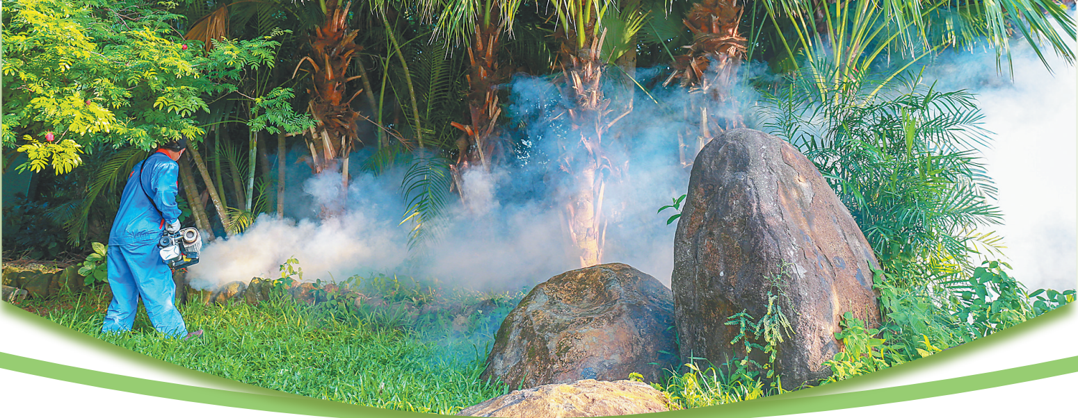
海口市人民公园内专业消杀队员深入绿化区域开展消杀工作。