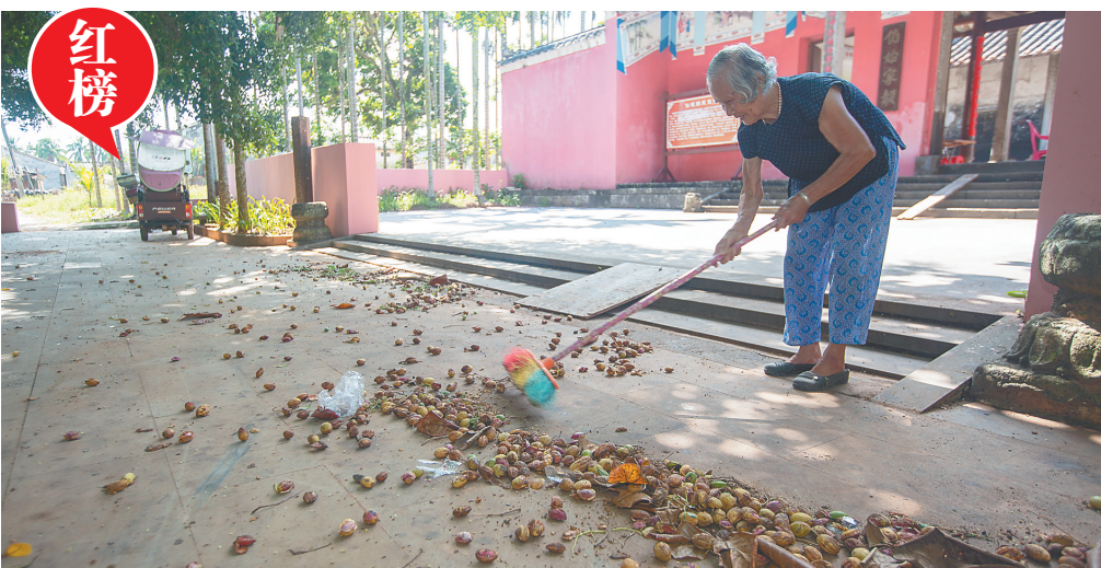
打扫卫生 人人参与

该比赛旨在引导中小學生掌握垃圾分类知识，提高垃圾分类意识，并鼓励他们争当垃圾分类的宣传者、先行者、实践者，树立健康绿色生活理念，加入到营造清洁、优美、舒适人居环境的队伍中来，共同营造垃圾分类的社会氛围。 比赛由省科协、省教育厅主办，海南日报有限责任公司承办。