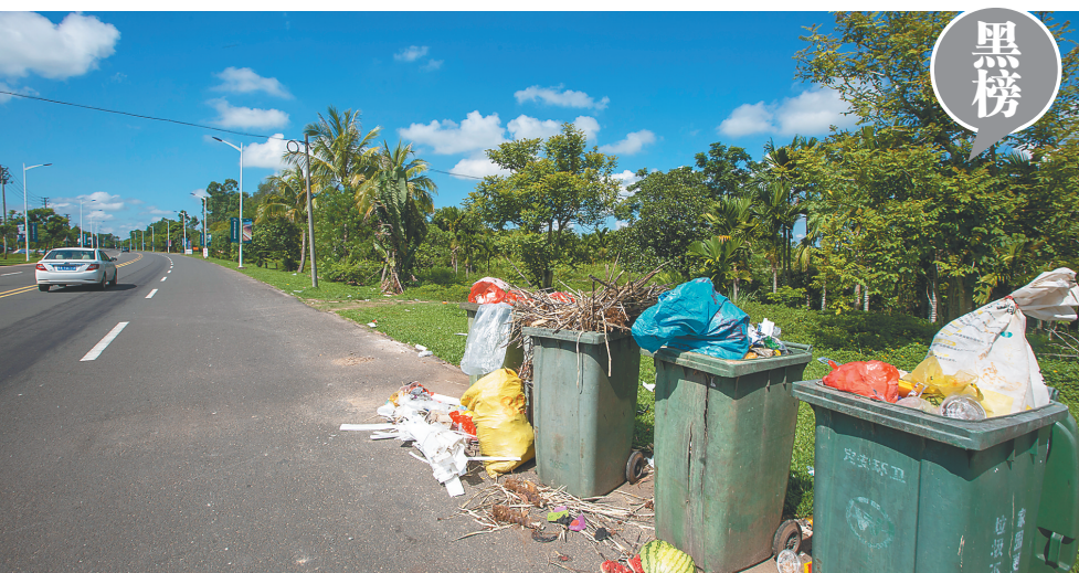
垃圾成堆 影响市容