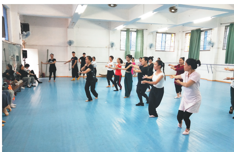
图为学员在学习舞蹈。

这次培训班由海南热带海洋学院民族学院、海南省少数民族艺术培训中心承办，共有来自全省18个市县、1