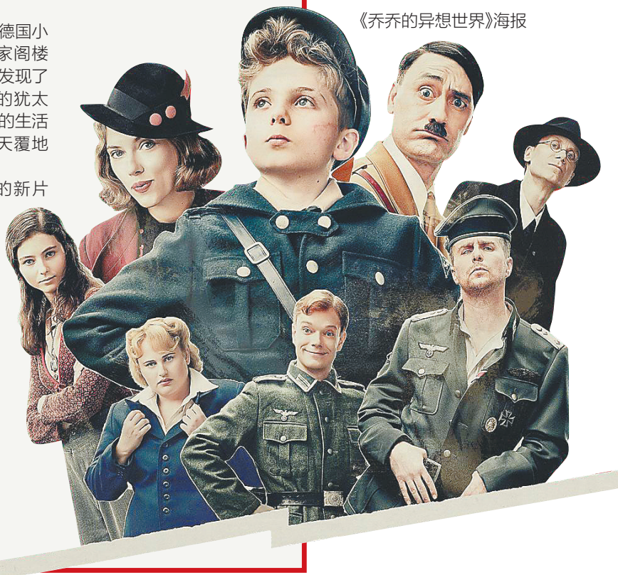
《乔乔的异想世界》海报

近期上映的新片中,充满黑色幽默的二战题材影片《乔乔的异想世界》备受好评,目前豆瓣评分为8.4。