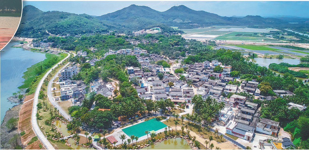
俯瞰琼海博鳌沙美村。