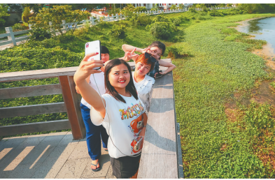
游客在沙美村合影留念。