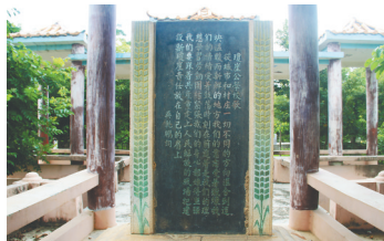
琼崖公学校歌碑文。