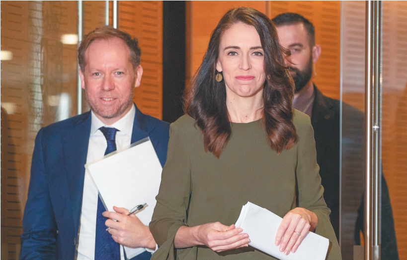
8月17日，新西兰总理阿德恩（前右）在首都惠灵顿出席一场新闻发布会。新西兰总理阿德恩17日宣布，将原定于9月19日举行的大选推迟四周至10月17日举行。

折，至今尚未正式公布全部安排，目前已确定24日开幕当天将有数百名党代表在主办地夏洛特现场投票，正式提名现任总统特朗普为共和党总统候选人。特朗普此前透露，他打算于27日在白宫草坪发表演讲接受提名。由于此举将打破惯例，因此引发质疑和批评。 浪潮，而竞选搭档、有多种族背景的马拉·哈里斯或将给拜登加分。 共和党方面对大会内容透露的信息不多，但据美国保守派媒体福克斯新闻台报道，大会的主题是“纪念伟大美国故事”，突出“（美国的）伟大、机遇以及特朗普总统果敢的领导力”。