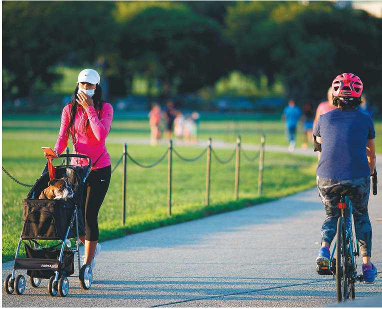
8月16日，人们在美国首都华盛顿的国家广场游玩。美国约翰斯·霍普金斯大学16日发布的新冠疫情最新统计数据显示，美国新冠累计死亡病例达170019例，累计确诊5401167例。

案展开磋商，民主党方面本月早些时候同意把邮政局拨款额度降至100亿美元，但整体谈判最终仍因双方分歧严重而破裂。 他当天早些时候在美国有线电视新闻网《国情咨文》节目中称，特朗普会同意为邮政局拨款100亿至250亿美元。梅多斯同时保证，邮政局在11月大选前不会再拆除邮件分拣机。邮政局16日也承诺，11月中旬前暂停拆除街头邮箱。 梅多斯反指邮寄投票恐致选举结果延迟公布，会让民主党渔利。“11月3日我们无法获知选举结果，甚至数月内都无从得知，对我而言这会有问题。因为依据宪法，届时应由众议院的南希·佩洛西（议长）在1月20日指定总统人选。” 海洋（新华社专特稿）