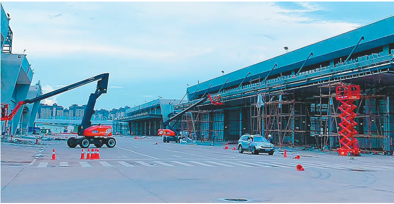
8月17日，海口市菜篮子江楠农产品批发市场，工人正在进行收尾施工。

“当食用农产品进入市场时，检测人员会进行抽检，完成所有样品的快速检测后，第一时间反馈至市场方