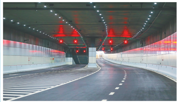
海口文明东隧道内景。