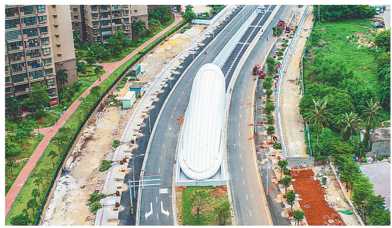
海口文明东隧道外景。