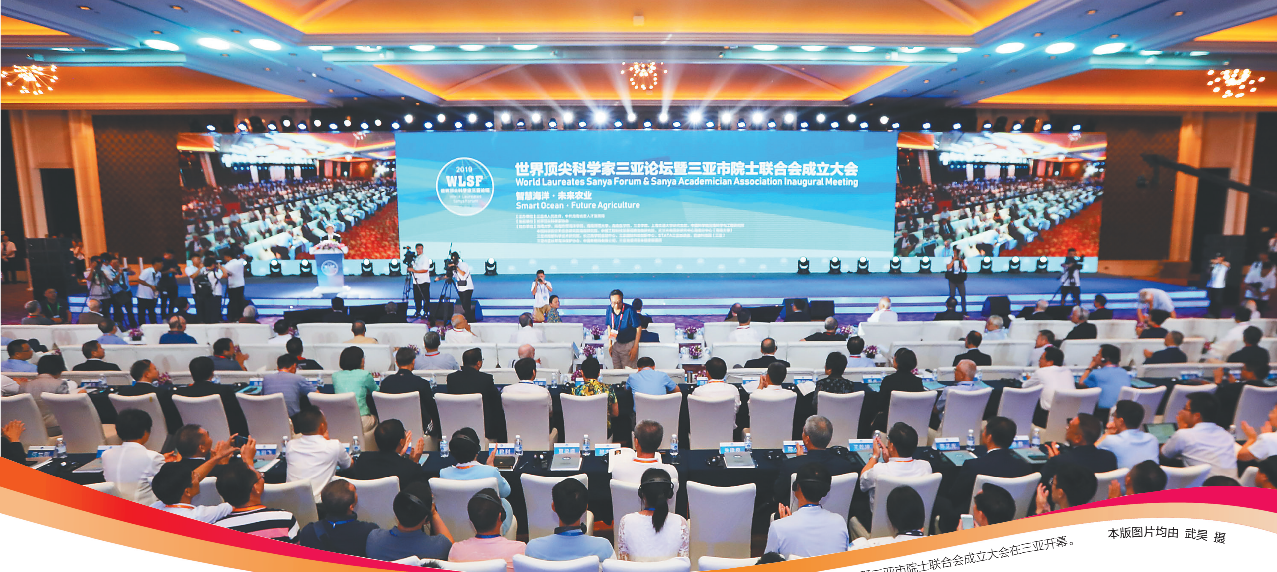
世界顶尖科学家三亚论坛暨三亚市院士联合会成立大会在三亚开幕。

人才是一个地区、一座城市发展的源动力。转型中的三亚，求贤若渴；发展中的三亚，海纳百川。近年来，三亚精心营造“院士文化”，丰富“院士资源”，培育“院士经济”，为鹿城创新发展提供了坚强的智力支撑。