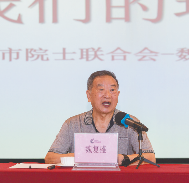
三亚中瑞酒店管理职业学院与三亚市院士联合会合办的“院士大讲堂”系列活动中，中国工程院院士魏复盛在授课。