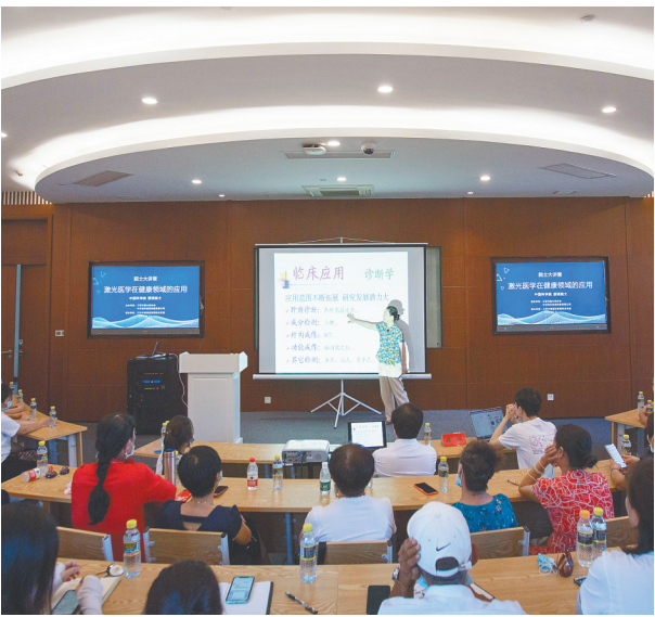
近日，中国科学院院士、三亚市院士联合会会长顾瑛在讲述激光医学在健康领域的应用。

“三亚市院士联合会不仅加强了三亚与中国科学院、工程院的联系，柔性引进了多名高端人才，同时也进一步推动了三亚市本土企业创新能力的提升，促进了产学研结合，成为推动三亚市创新发展新的引擎。”三亚市委组织部有关负责人介绍。