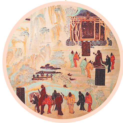
莫高窟中关于张骞出使西域的壁画。