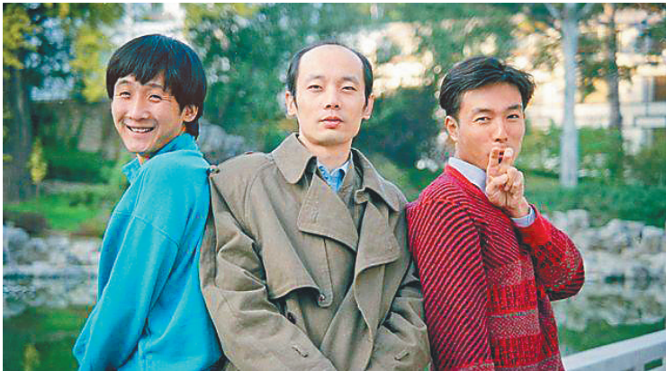
梁天(左)和葛优、谢园(右)三人被称为中国内地“喜剧三剑客”。 本版图片均为资料图

在上世纪那个物质相对匮乏的年代,谢园等老一辈演员们充满了对影视行业的热爱与激情。后来,他们在风起云涌的时代逐渐被“后浪”所超越,不再独领风骚,逐渐归于沉寂。谢园去世后,葛优发声表示:“观众会永远记住谢园对中国电影、电视剧所作出的努力和贡献。”梁天说:“所有和谢园合作过的业内人士,都会怀念他曾经给我们带来的快乐和感动,愿他的灵魂,面朝大海,春暖花开……从此天堂不再寂寞。”