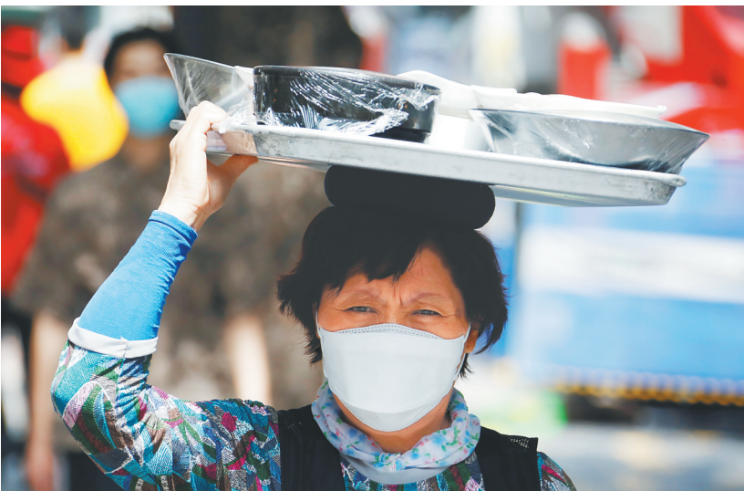
8月24日，一名戴口罩的韩国女子头顶托盘运送餐食。

新华社日内瓦8月23日电（记者刘曲）世界卫生组织23日公布的最新数据显示，全球累计新冠确诊病例超过2300万例，达23057288例；死亡病例超过80万例，达800906例。 世卫组织网站最新数据显示，截至欧洲中部时间23日12时48分（北京时间18时48分），全球确诊病例较前一日增加244223例，达到23057288例；死亡病例增加5772例，达到800906例。 目前，美国和巴西是全球累计确诊病例和死亡病例均排名前两位的国家。美国累计确诊5567217例，累计死亡174246例；巴西累计确诊3532330例，累计死亡113358例。