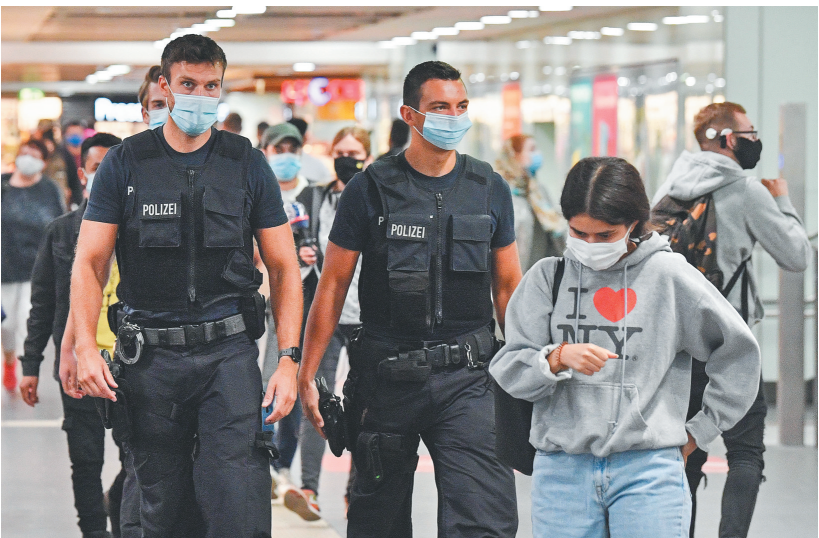
8月24日，警察在德国埃森火车站巡逻，以确保人们佩戴好口罩。