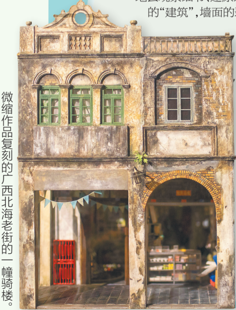
微缩作品复刻的广西北海老街的一幢骑楼。

袖珍“世界”常常引来人们啧啧称奇,让人忍不住去一探究竟,这份好奇背后是对技艺的惊叹,同时映射出忙碌生活下都市人的不泯童心。