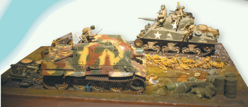
第二次世界大战中雨后战场的微缩作品。