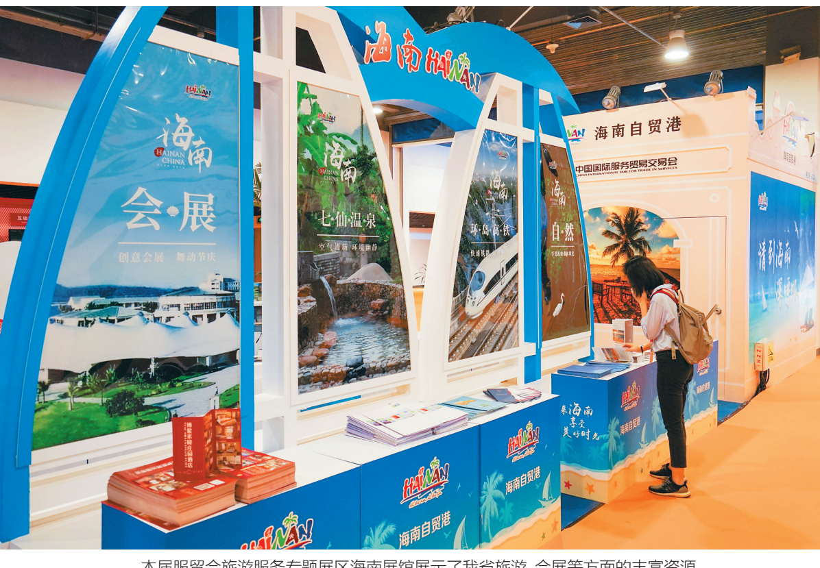
本届服贸会旅游服务专题展区海南展馆展示了我省旅游、会展等方面的丰富资源。

际免税城、海口观澜湖华谊冯小刚电影公社、海南环岛自行车赛、海南日月湾、海口世纪大桥夜景也通过图片得到展示。 位于旅游服务专题展区显眼位置的海南展馆通过系列宣传图片展示海南10大旅游产品体系，突出展现海南的免税购物、康养旅游、乡村旅游以及海南的清新空气等旅游资源，充分体现“热带海岛度假、生态旅游、免税购物天堂”的海南旅游形象。展馆现场还搭建了“海南黎族船型屋”，集中展示黎族织锦、制陶等海南省非物质文化遗产技艺。 除此之外，展馆还设置了“海南小景特色合影区”，开展拍照参与幸运抽奖互动活动，以及海南旅游主题产品“翻翻乐”、迷你高尔夫推杆体验、竹签投壶等各类趣味横生的现场游戏，并带来丰富的海南特色礼品，为参观众众提供更多互动感与参与感。 位于文化服务专题展区内的海南馆以“美好新海南·启航自贸港”为主题，着力展示我省文化与旅游融合发展成效，突出展示文化旅游重点企业和项目，集中呈现全省精品旅游和文化产业的新成果、新产品和新面貌，重点推介本土特色文化创意产品。240平方米的展馆以蓝白色为主色调，以海南特有的地域造型为设计灵感，凸显海南这一21世纪海上丝绸之路重要节点的海洋文化背景。