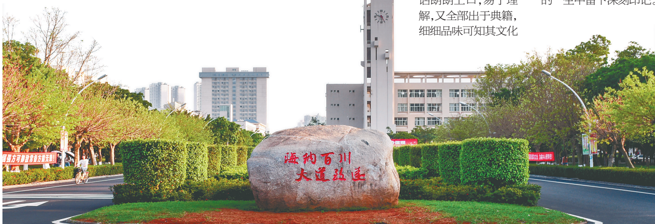
海南大学校训石。

秋风又起，迎新入校，各校校训的吟诵将在座座校园琅琅响起。珍重历史、立足当下、开启未来，对校训的理解和践行必将在莘莘学子的一生中留下深刻印记。