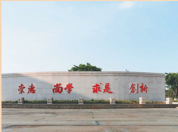
海南师范大学校训墙。