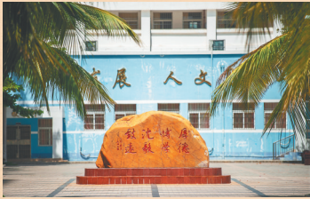
海口市第一中学校训石。