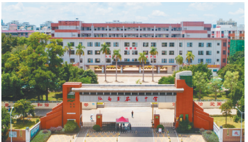
海南农垦中学。