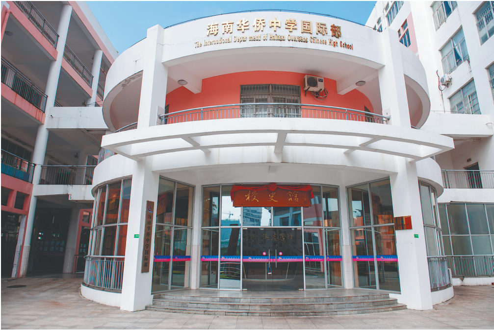
海南华侨中学。

旧有效,比喻国基坚固,国祚永存。”杨本科说,“‘亲爱精诚’则是黄埔军校校训,‘努力学业,勇往迈进’是国立第二华侨中学的校训,这些都具有深刻的时代意义。”