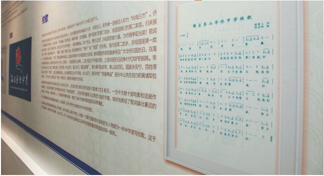
海南华侨中学校史馆中展示的校歌词曲。