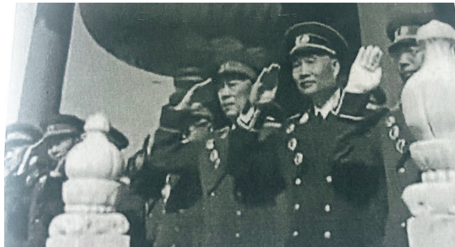
1959年国庆10周年庆典,周士第(右3)在天安门城楼观礼。

1979年4月,周士第将军的部分著述,内容包括关于铁甲车队、叶挺独立团、南昌起义的回忆等9篇共15.3万字,汇编成《周士第回忆录》一书,由人民出版社出版。此时,这位从共产党建军的第一天就担任指挥员的老将军已在弥留之际。当他看到凝聚着自己心血结晶的回忆录问世,脸上掠过一丝欣慰的笑容。有史家指出,这本不可多得的有益读物,给后人传下来一份生动说明中共最早建军的宝贵史料。将军写于各历史时期的文字,为军史、党史研究提供了极其宝贵的第一手材料,为我军革命化、现代化、正规化建设作出贡献。