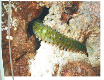
藏身于礁石间的博比特虫。