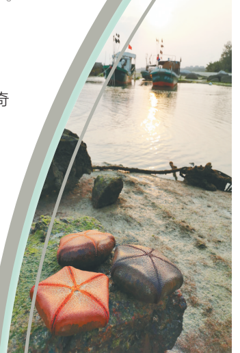
面包海星乍一看很像小包裹。

我们的原则是尽量只是观察和体会,不把野生动植物带回家,特别是保护级别的物种,我们欣赏、赞美生物多样性,但不把自然之美据为己有。