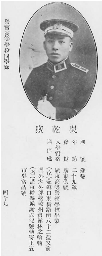
儋州王五人吴乾煦在北京读书时的同学录信息。