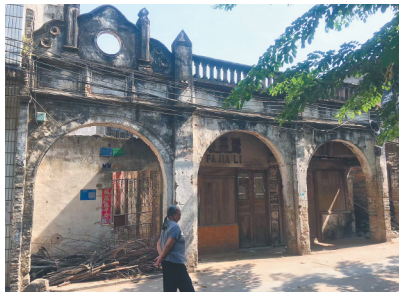
儋州市王五镇上斑驳的民国骑楼。

在王五坊间，“东嘉积，西王五”的说法一直广为流传。所谓“东嘉积，西王五”，指岛东的重镇嘉积和岛西的重镇王五。民国《儋县志》中关于王五的记载：“黎方山货、海滨鱼盐及故乡之糯米薯粮，咸集合交易于此，诚为琼西交通之一重镇也。”说明当时王五已经对周边乡镇起到了市场辐射的作用，是岛西地区重要的商贸中心。