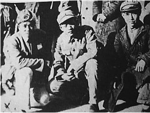
符克（左一）在延安，与陕北公学的学员合影。（资料图）

2019年2月4日，吾与亲友一行8人由重庆飞抵海口。在琼期间，专程驱车到了文昌市昌洒镇宋氏祖居、宋庆龄纪念馆、符克烈士纪念馆等地，参观、游览、收集相关资料。回渝后，对之前所写文稿《笔墨放异彩 正气满乾坤——符克先生纪念册之两帧珍贵题词及其联想》一万多字文稿进行修改、配图。此文收入《笺染墨香》一书（朱渝生著，西南师范大学出版社2019年5月版）。由于当时时间仓促，采访不够深入，再加上之前掌握的资料有限，故有诸多关于符克烈士光辉事迹和珍贵图片未能入书，留下些许遗憾。