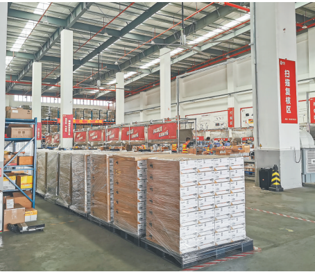
位于广州南沙区的卓志全球优品国际分拨中心分拣车间。在这里，货物将被分发到国内各地通过天猫商城网购的消费者手上。

广州市发改委相关负责人介绍，今年以来，广州已围绕企业开办、建筑许可、纳税、信用建设等重点领域出台190份政策文件，着力提效降费优服务，支持企业复工复产渡难关，全力打造一流营商环境，推动全市经济高质量发展。