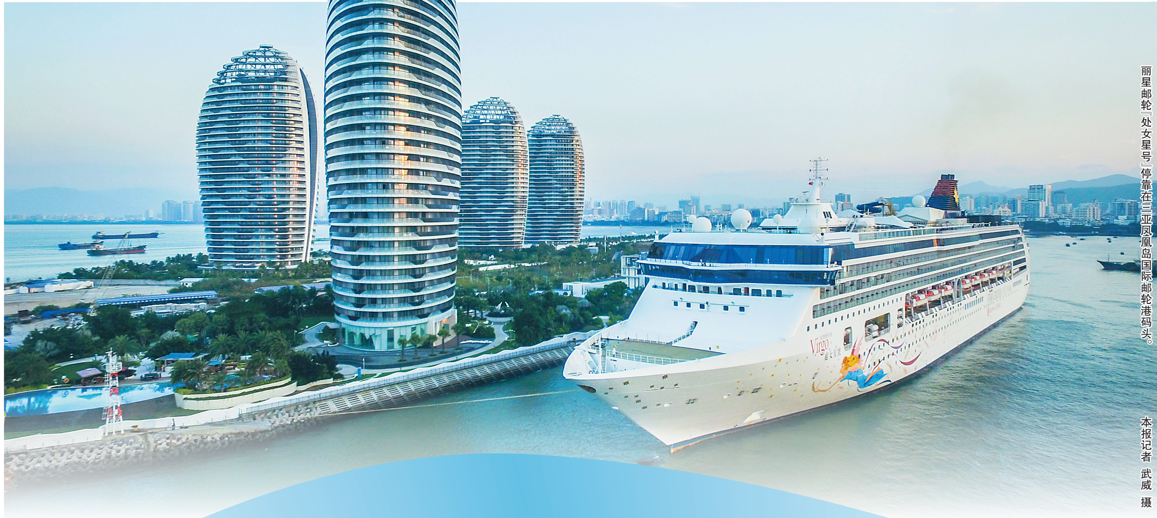
丽星邮轮 外文星号 停靠在三亚凤凰岛国际邮轮港码头。