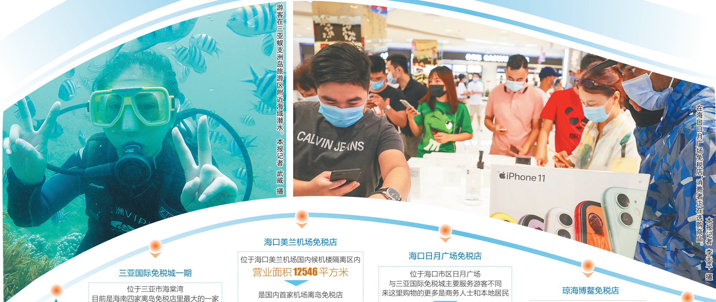
在海口日月广场免税店,消费者正在选购商品。