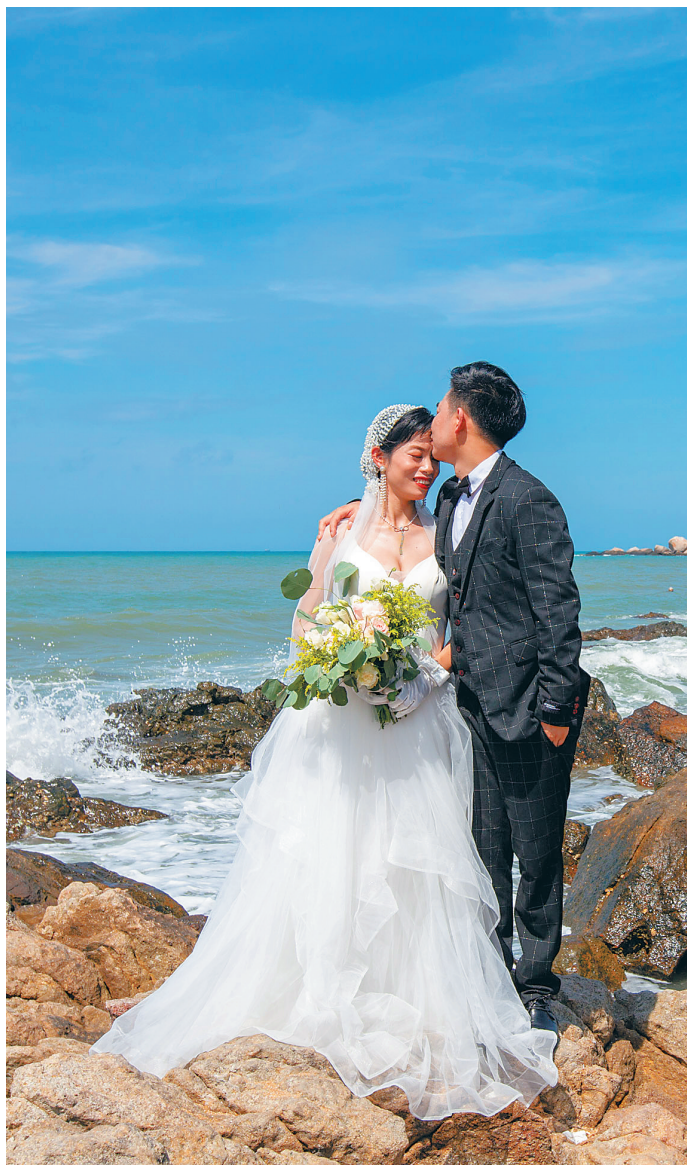
新人在三亚天涯海角游览区婚纱摄影基地拍摄婚纱照。