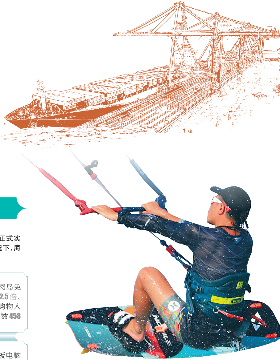
风筝冲浪爱好者在琼海博鳌浪尖上起舞。