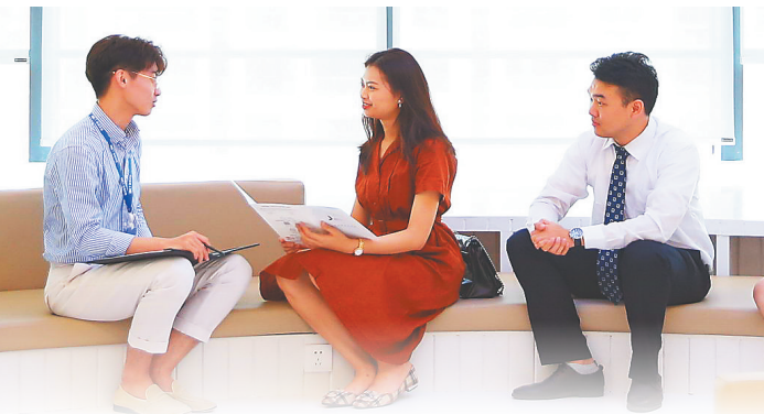
随着海南营商环境的不断优化，吸引着越来越多的企业和人才落地。在位于海口的全球贸易之窗写字楼里，工作人员进行商务接待和为入驻企业提供一站式商务服务。