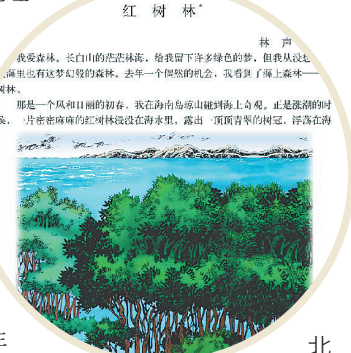
北师大版语文课本中的《红树林》。