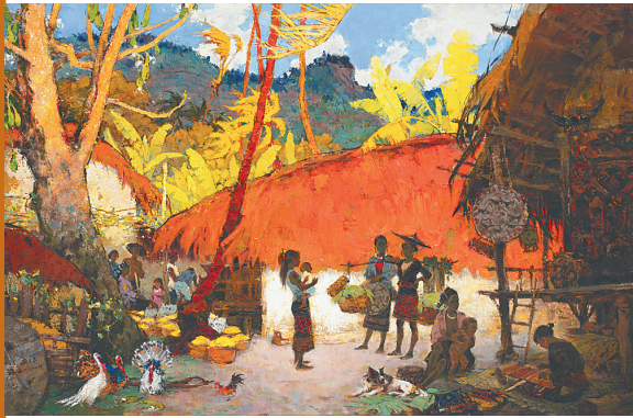
《流金岁月》(油画) 王家儒