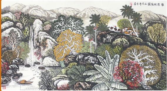
《黎寨秋艳图》(山水画) 邓子芳