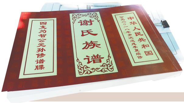
公支系新修的族谱。二零一八年临高谢氏为智

族谱，不仅记载着家族的历史，也是挖掘地方历史文化的途径。临高谢氏族人说，谢氏各支系后代都要认真地修谱，因为修谱对于他们来说是一种使命、一种责任，要一代代延续下去。■