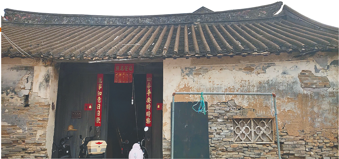
保平村周家“明经第”祖屋已经十分老旧。