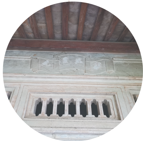
崖州周氏“明经第”故居，为贡生周定士所建。门楣上原有灰塑的“作述重光”四字。

清代，保平村周有伦、周子翰、周定士祖孙三代的故事，一度传为美谈，至今仍有人称道。“明经第”门楼上原有的一副对联“门第多积善，家世重儒风”，是对这个家族家风的极好概括。