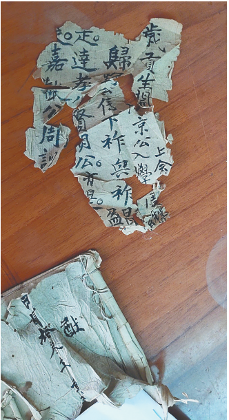
民国年间续修的《周氏族谱》，有些页张已经破损。