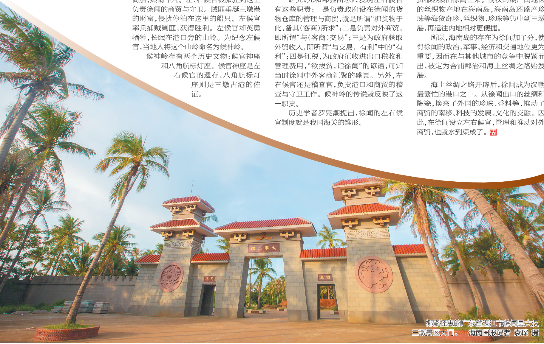
椰影摇曳的广东省湛江市徐闻县大汉三墩景区大门。

公元前110年，率军统一岭南的伏波将军路博德来到了雷州半岛南端。 成书于三世纪中叶的史书《交州外域记》，被普遍认为是交趾的信史。虽然书已散佚，但幸运的是，权威地理著作《水经注》中转引了很多文字。其中，《水经注》第37卷有一段关于路博德的话：“《交州外域记》曰：……路将军到合浦……乃拜二使者为交趾、九真太守。” 雷州半岛南端，就是徐闻汉朝古城和汉朝古港所在地，也是前汉的合浦郡治所在地。可以肯定，路博德将军到过徐闻。 徐闻当地传说，徐闻是由路博德将军命名的。路博德将军认为，这里僻处岭南陆地南端，汉之威德徐徐方至，所以定名为“徐闻”。路博德到来后，这里迅速建起了徐闻古城和徐闻古港，并被定为合浦郡治。 为什么前汉会选择徐闻作为合浦郡治，而不是合浦等其他城市呢？因为徐闻地处陆海交通的十字路口，是控扼海南岛的要塞。 从海上交通来说，在只有浅海航行能力的前汉时期，船只很难越过深海，只能沿着海岸线航行。所以，琼州海峡就成为番禺（广州）等我国沿海各港口前往北部湾、交趾和南洋各国不可逾越的海洋要途。而位于琼州海峡北岸中段的徐闻古港，就成为往来商人、船只的必停港。 在前汉时期，岭南地区的陆地重要交通线如下：以苍梧（梧州）为枢纽，向北由漓江、灵渠连接湘江，这是岭南连接中原内地的主要交通线；向东由珠江连接番禺；向南由北流江、南流江连接合浦，再由徐闻渡琼州海峡到海南岛。徐闻成为海南岛联结内地几乎唯一的交通线，海南岛与内地的商贸都必须由徐闻往来。前汉时期广南地区的丝织物产地在海南岛，海南岛还盛产珍珠等海货奇珍，丝织物、珍珠等集中到三墩港，再运往内地相对更便捷。 所以，海南岛的存在为徐闻加了分，使得徐闻的政治、军事、经济和交通地位更为重要，因而在与其他城市的竞争中脱颖而出，被定为合浦郡治和海上丝绸之路始发港。 海上丝绸之路开辟后，徐闻成为汉朝最繁忙的港口之一。从徐闻出口的丝绸和陶瓷，换来了外国的珍珠、香料等，推动了商贸的南移、科技的发展、文化的交融。因此，在徐闻设立左右候官，管理和推动对外商贸，也就水到渠成了。■