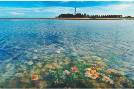
徐闻灯楼角美景。（资料图）

在三墩古港旁，有个山岭名为候神岭，其得名有个传说。 在汉朝，三墩古港汇集了南洋各国的商船，热闹非凡。左、右候官被派驻到这里负责徐闻的商贸与守卫。贼匪垂涎三墩港的财富，侵扰停泊在这里的船只。左候官率兵捕贼剿匪，获得胜利。左候官却英勇牺牲，长眠在港口旁的山岭。为纪念左候官，当地人将这个山岭命名为候神岭。 候神岭存有两个历史文物：候官神座和八角航标灯座。候官神座是左右候官的遗存，八角航标灯座则是三墩古港的佐证。