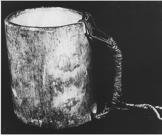
独立总队战士自制的竹口杯。