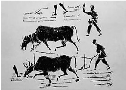
汉画像拓片《耕播图》。