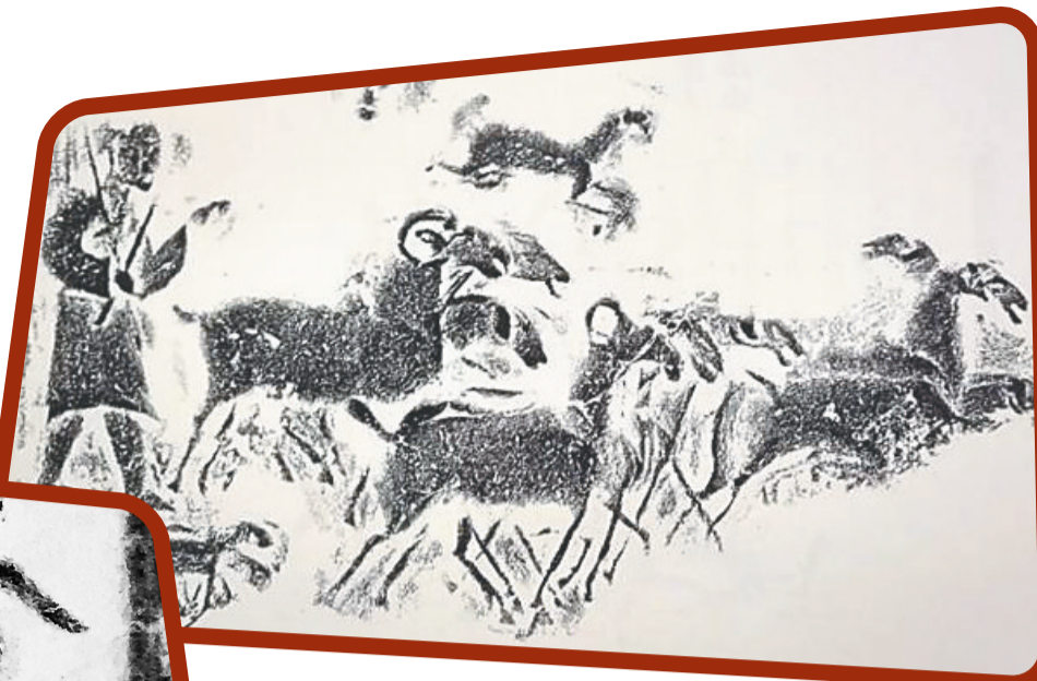
汉画像拓片《牧羊图》。