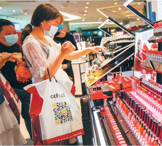
顾客在三亚国际免税城选购免税商品。

近年来，三亚国际免税城始终坚持以顾客需求为导向，将提升顾客的免税购物体验作为重点工作来抓实抓牢。在企业运营管理中，三亚国际免税城坚持以党建为引领，通过树立服务典型、店内带教培训、店铺模拟细节补漏、加强员工心理辅导、弘扬服务精神等多项举措，为顾客提供更加优质的服务。