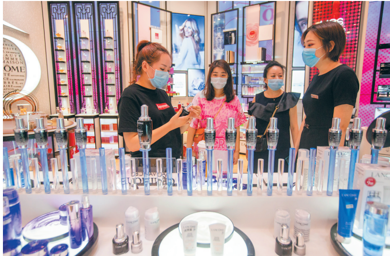
顾客在三亚国际免税城选购免税商品。