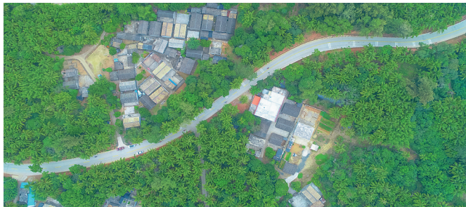
俯瞰文昌市县道改造工程(烟墩至长坡段),这是我省农村公路交通扶贫六大工程项目之一,建成后惠及沿线约2.6万余村民。